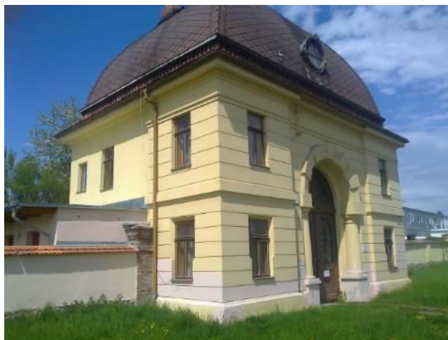
Obr.: Obřadní síň židovského hřbitova v Šumperku

Od srpna 2013 se členové Jesenického horského spolku zapojili do údržby areálu židovského hřbitova a obřadní síně v Šumperku. Židovský hřbitov v Šumperku byl zřízen v roce 1911, ve stejném roce postavena i obřadní síň, zvýšená nástavbou kupole v roce 1932. Areál je v majetku Federace židovských obcí v ČR. Zapojili jsme se do osekávání plochy hřbitova a drobných oprav služebního bytu v objektu obřadní síně. V letech 2014-15 byl služební byt dovybaven a byly zrealizovány drobné opravy, před obřadní síň jsme osadili historické žulové patníky z roku 1870 k vymezení prostoru před obřadní síní. V letech 2016-18 byla doplněna žulová dlažba před vstupem. Zpřístupňování areálu hřbitova probíhá i ve spolupráci s našim partnerským sdružením Respekt&Tolerance z Loštic, které pečuje o synagogy v Lošticích a Úsově. V roce 2018 nás poctil svoji návštěvou německý velvyslanec JE Dr. Christoph Israng, který uctil památku šumperských obětí holocaustu.